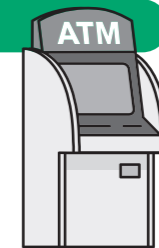
※ATMでの申請には 健康保険証は不要です。

ATMからの 申請が最も簡単です。 24時間対応で、 手数料無料ででき、 申請時間は 約2分間ほどで 完了します。