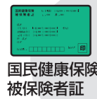
国民健康保険被保険者証